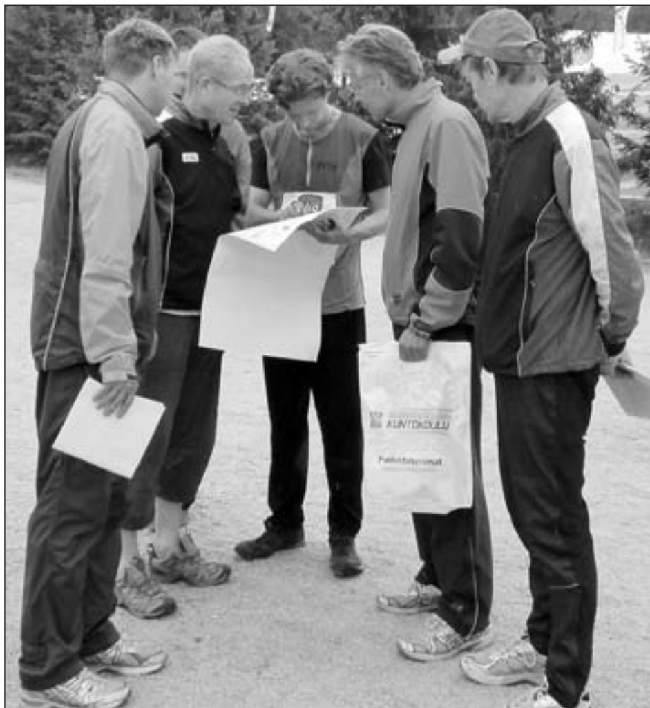
Tiukkaa kartan lukua ja selityksiä.