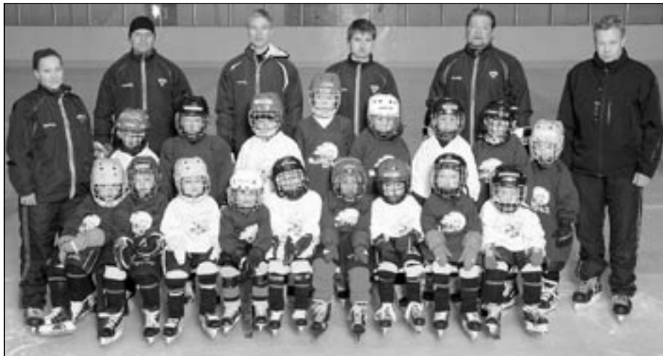
Vuoden 2010–2011 kiekkokoulu ryhmäkuvassa.