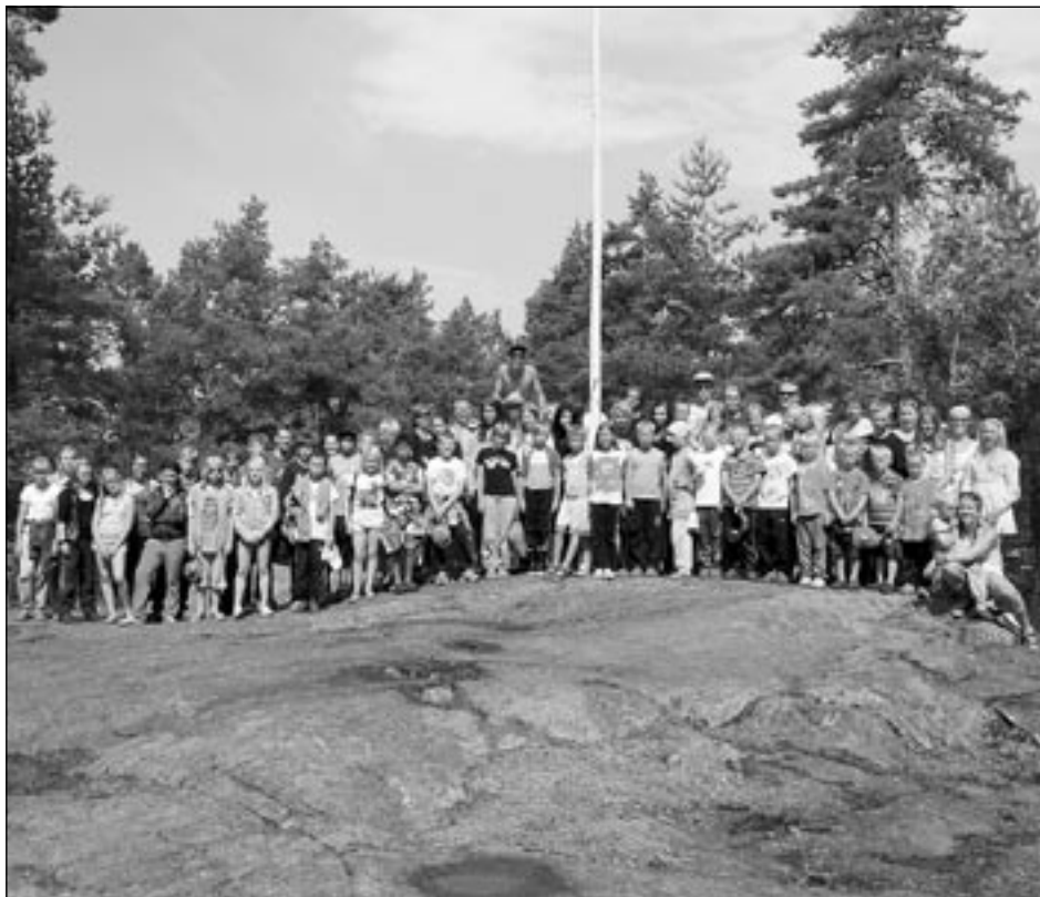
Leiriläiset perinteisessä yhteispotretissa Lippukalliolla.

vasta kahdeksantoistavuotias. Pitkällä tähtäimellä vapaaehtoistyön kantava voima onkin juuri jatkuvuus. Moni tämän vuoden vanhemmista leiriläisistä esitti jo nyt toivomuksiaan siitä, että voisivat seuraavina vuosina olla itse mukana tekemässä leiriä vapaaehtoistyöläisinä. Tämä on paras palkinto omasta työstä.