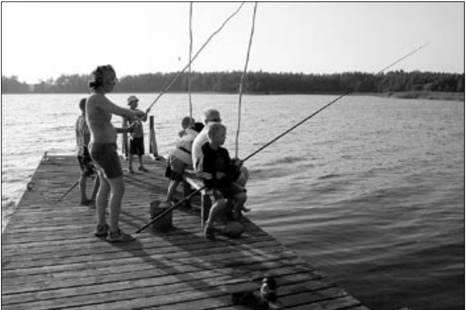
Kalastus on erittäin suosittua toimintaa leirillä.